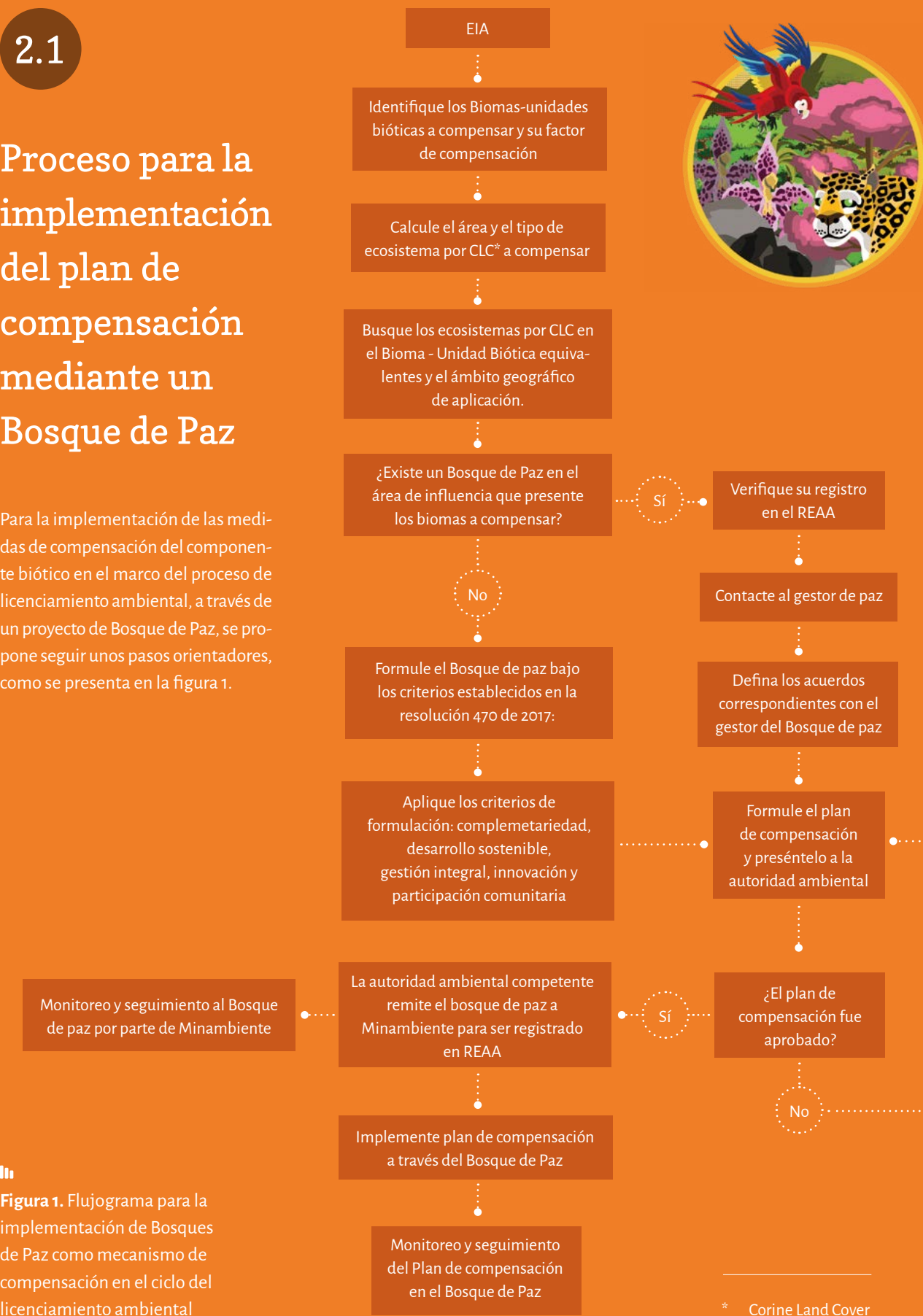
Figura 1. Flujograma para la implementación de Bosques de Paz como mecanismo de compensación en el ciclo del licenciamiento ambiental

Para la implementación de las medidas de compensación del componente biótico en el marco del proceso de licenciamiento ambiental, a través de un proyecto de Bosque de Paz, se propone seguir unos pasos orientadores, como se presenta en la figura 1.